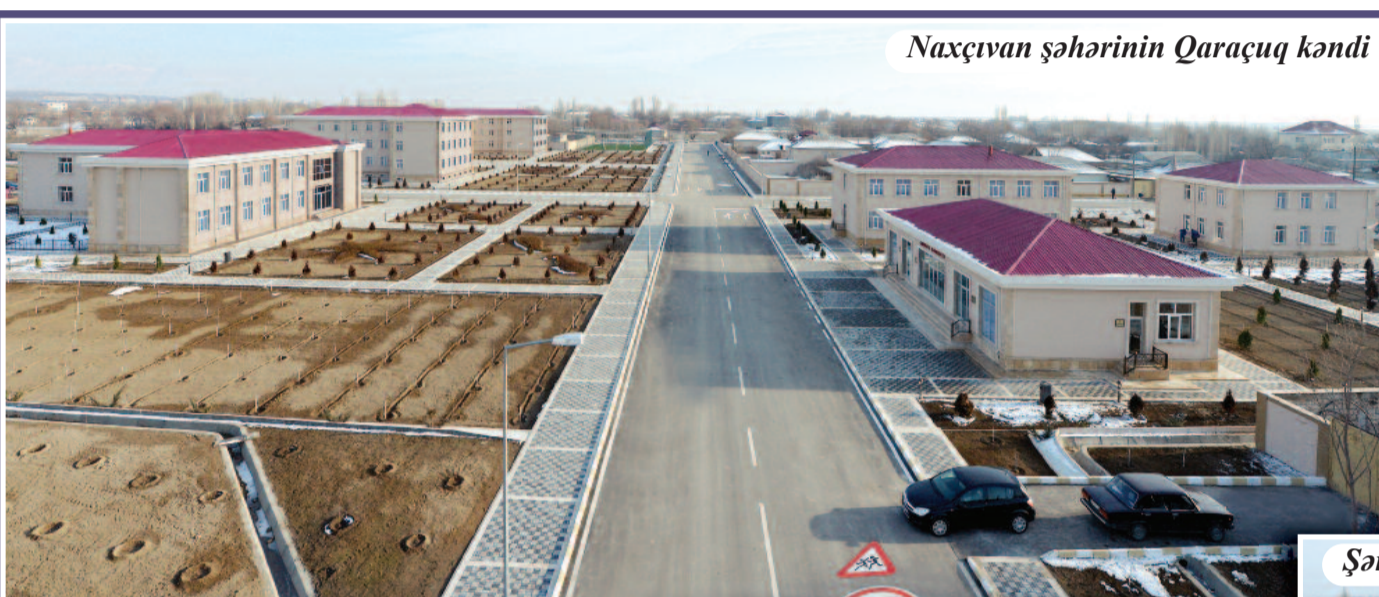
Naxçıvan şəhərinin Qaraçuq kəndi