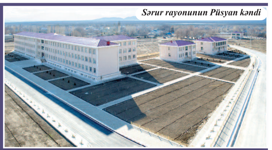
Şərur rayonunun Püsyən kəndi