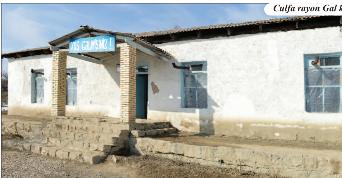
Culfa rayon Gal kənd tam orta məktəbi