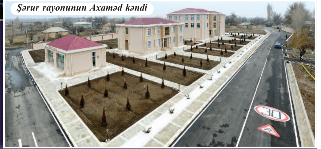
Şərur rayonunun Axaşad kəndi