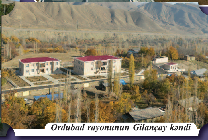
Ordubad rayonunun Gilançay kəndi