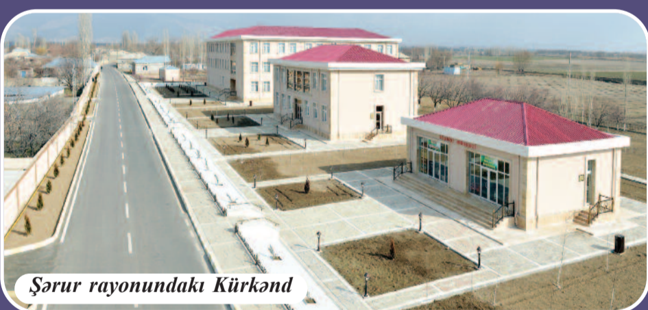
Şərur rayonundakı Kürkənd