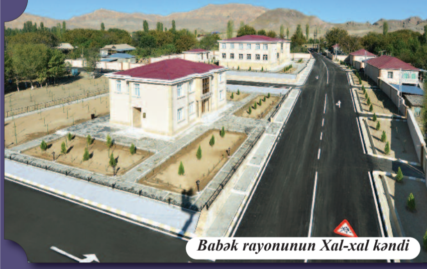
Babək rayonunun Xal-xal kəndi