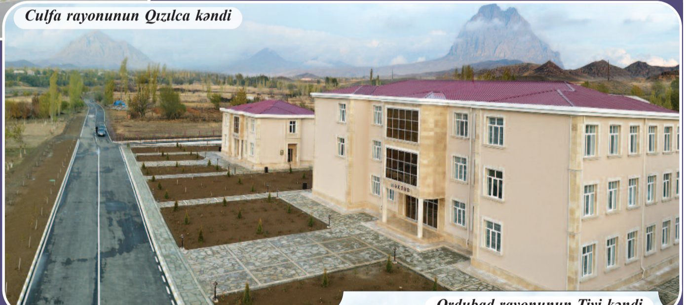
Culfa rayonunun Qızılca kəndi