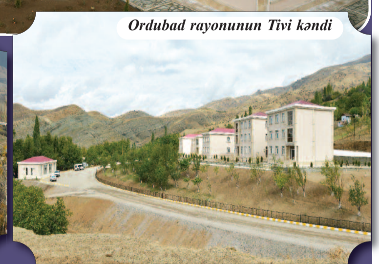
Ordubad rayonunun Tivi kəndi

İllərdir ki, muxtar respublikamız davamlı xarakter alan tikinti-quruculuq prosesləri hesabına ölkəmizin öndə gedən regionları sırasındadır. Bu proses şəhər və rayon mərkəzləri ilə məhdudlaşmayaraq ən ucqar dağ və sərhəd yaşayış məntəqələrini də əhatə edir. Bu işlər sırasında ən çox diqqəti cəlb edən kəndlərin abadlaşdırılması istiqamətində görülən kompleks tədbirlərdir. Sistemli və düşünülmüş şəkildə aparılan işlərin əsas məqsədi